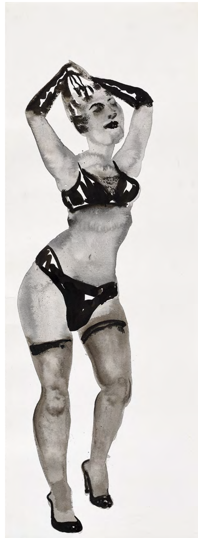
Untitled, 2017 Watercolor and ink on paper 70.5 x 26 cm