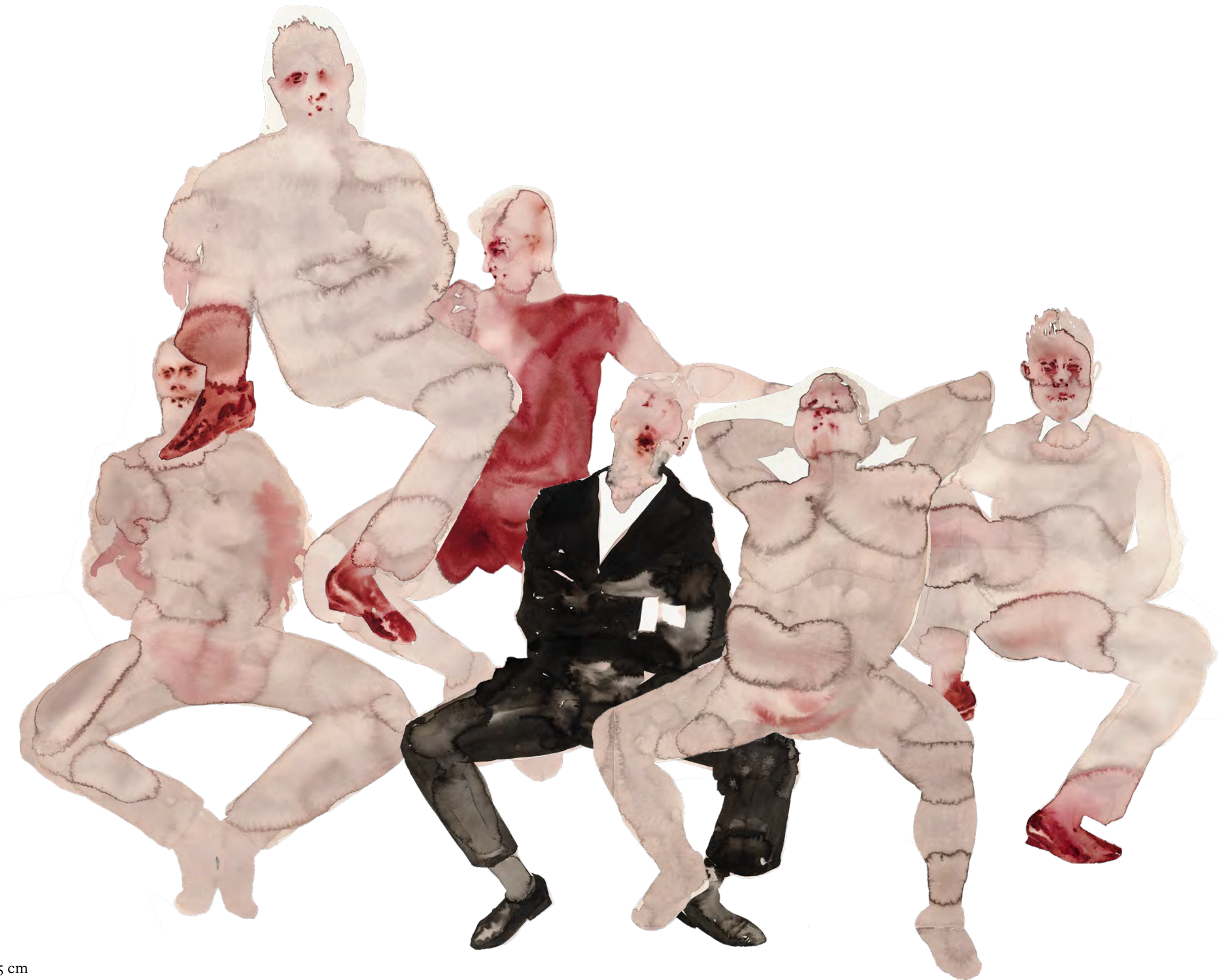
The battle of knees, 2024 Watercolor and Ink on paper Each drawing approx. 50 x 35 cm