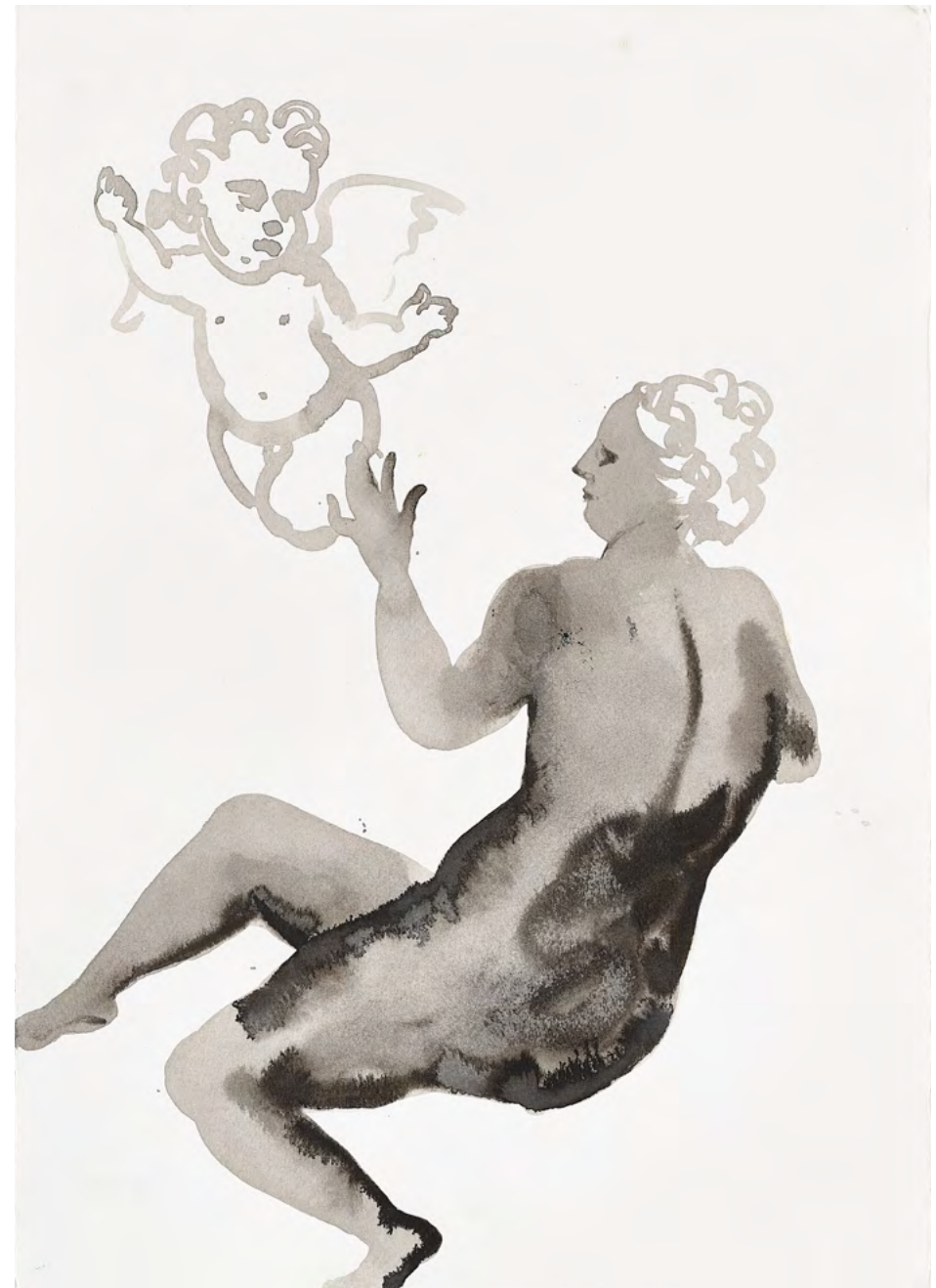
Venus and Cupid, 2017 Watercolor and ink on paper 50 x 35.5 cm