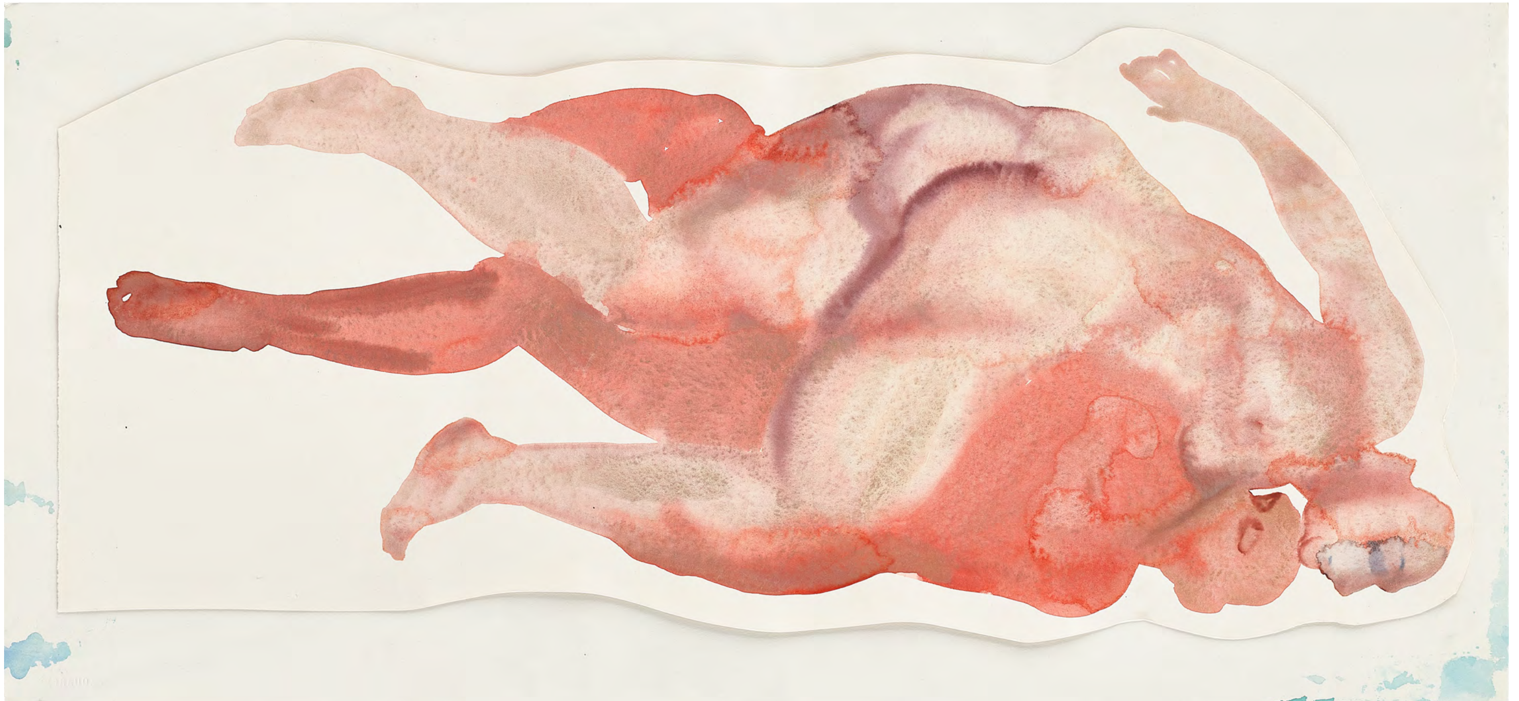
Untitled, 2018 Watercolor and ink on paper 36 x 76.5 cm