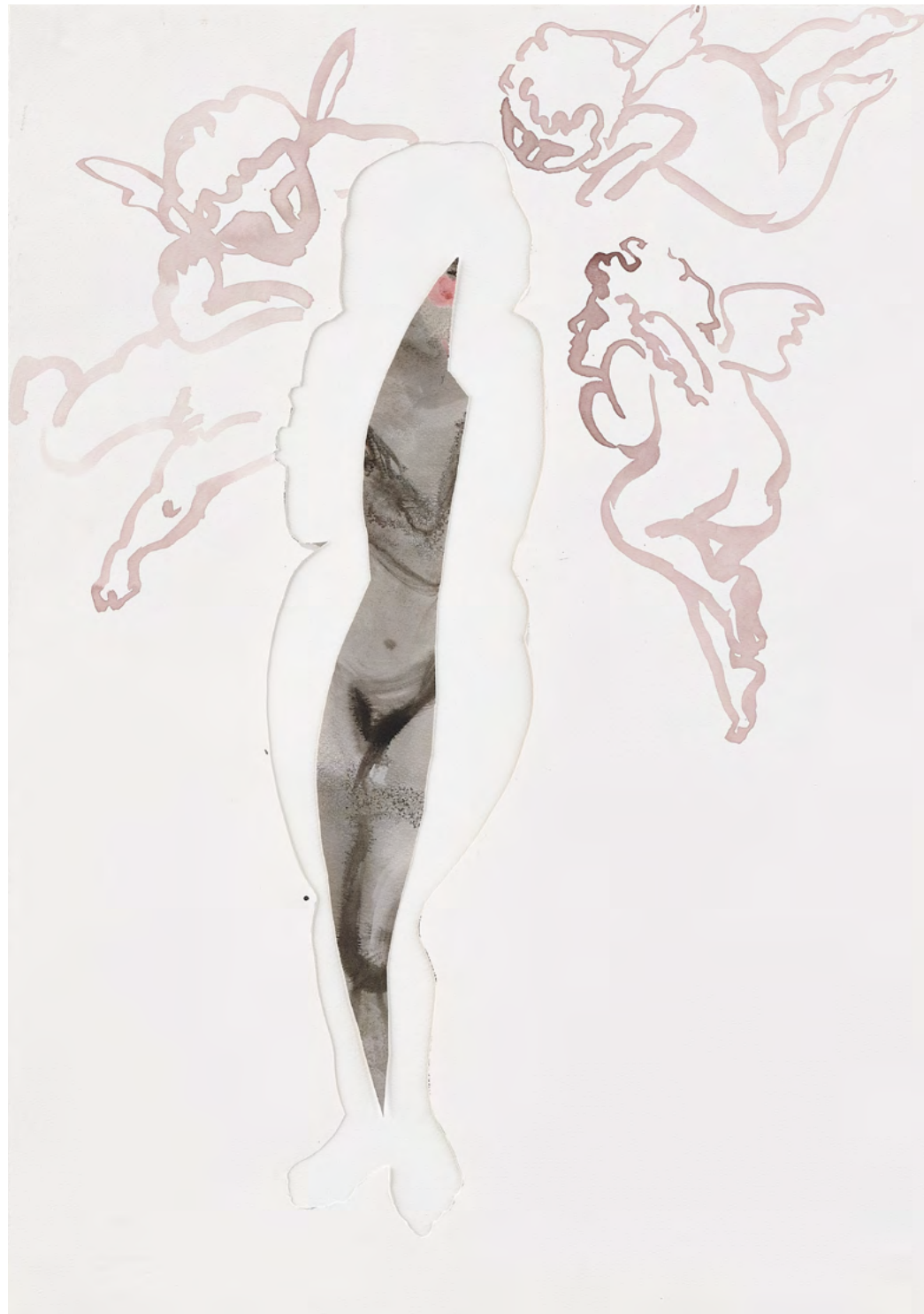
The Return of Spring, 2017 Watercolor and ink on paper 70.5 x 50 cm