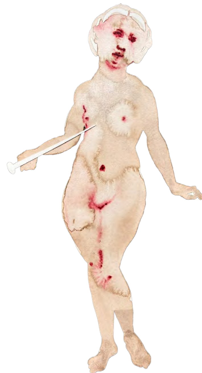
Lucretia, 2023 Watercolor and ink on paper 36 x 20 cm