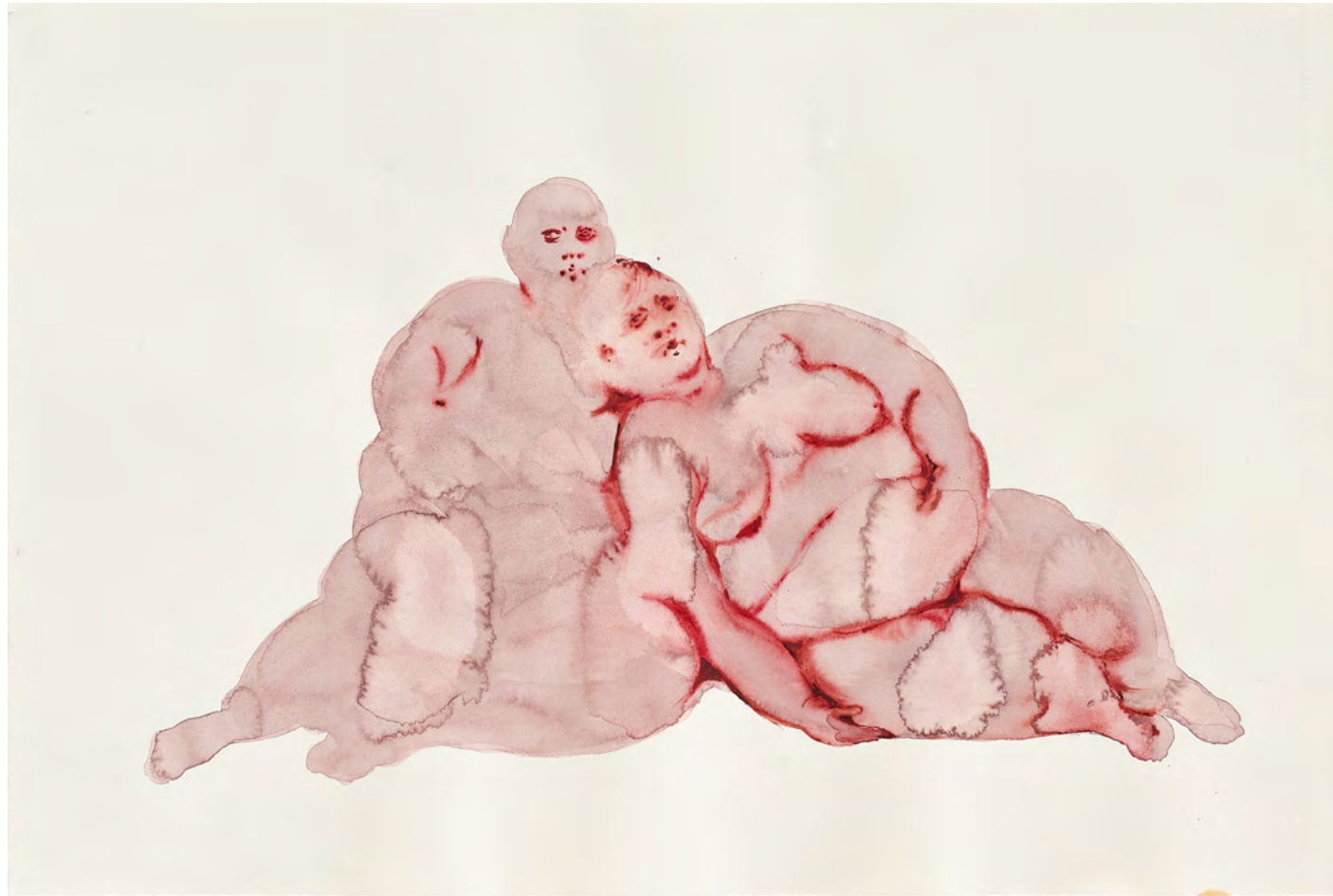
Untitled, 2023 Watercolor and ink on paper 38 x 57 cm