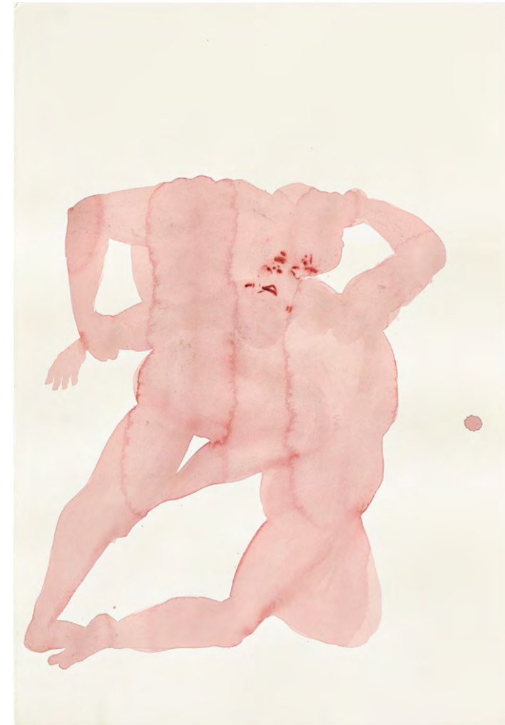
Dante and Virgil, 2023 Watercolor and ink on paper 56 x 38 cm