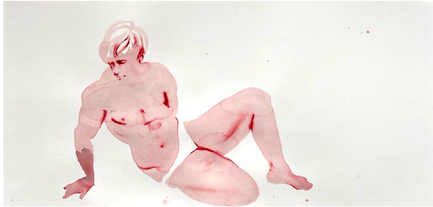
Untitled, 2023 Watercolor and ink on paper 38 x 57 cm