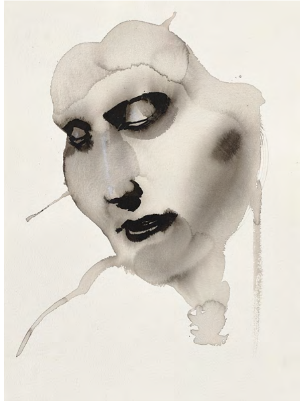
Untitled, 2017 Watercolor and ink on paper 39 x 28.5 cm