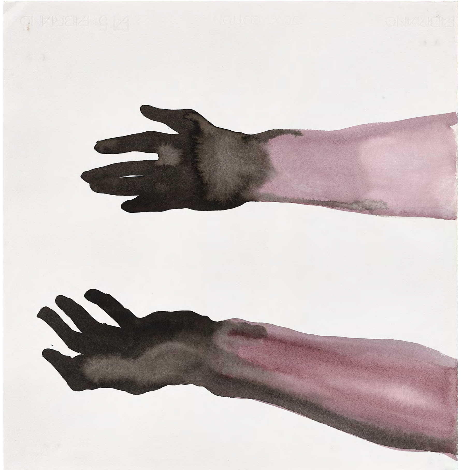
Untitled, 2017 Watercolor and Ink on paper 52 x 50 cm