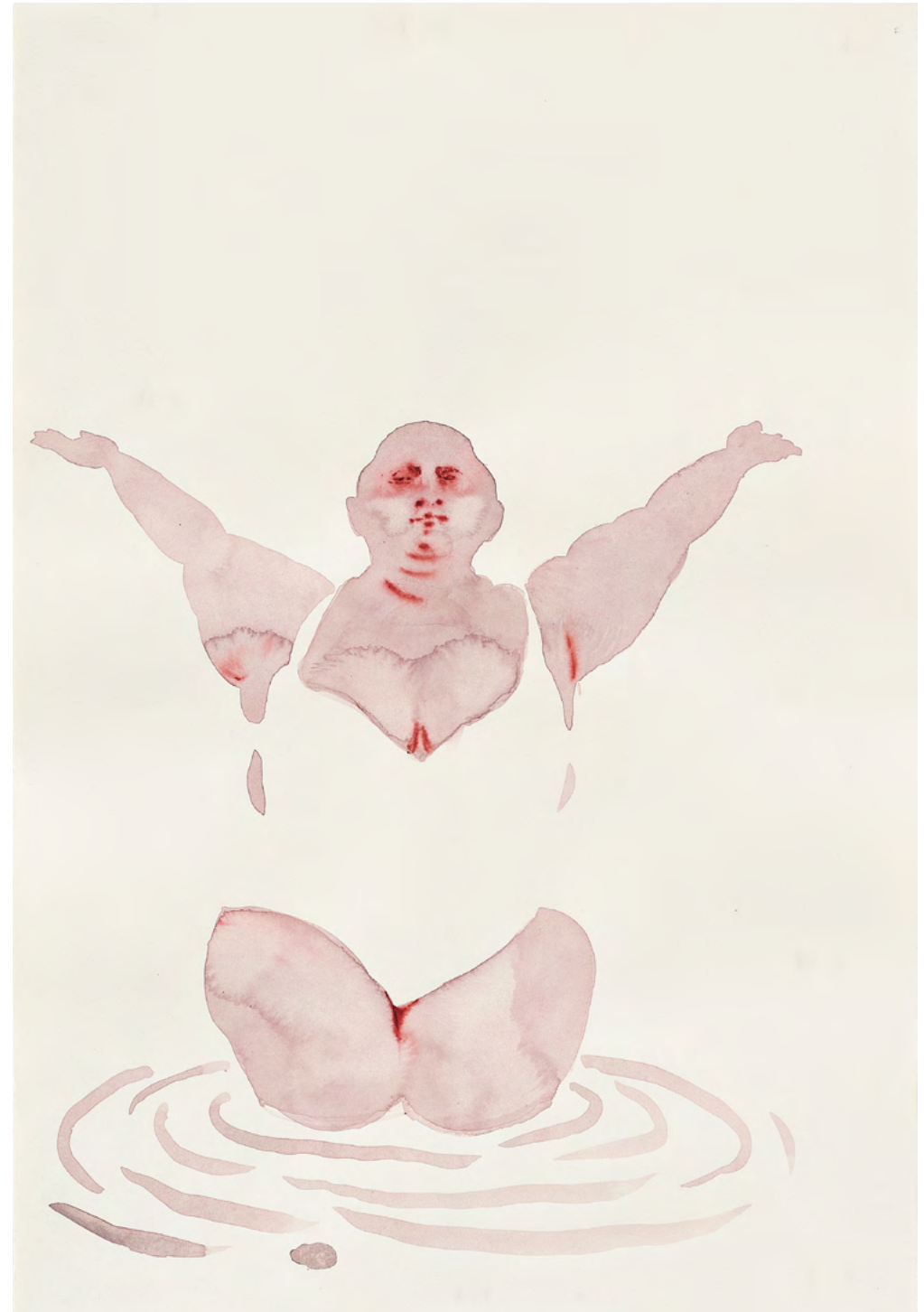
Untitled, 2023 Watercolor and ink on paper 57 x 38 cm