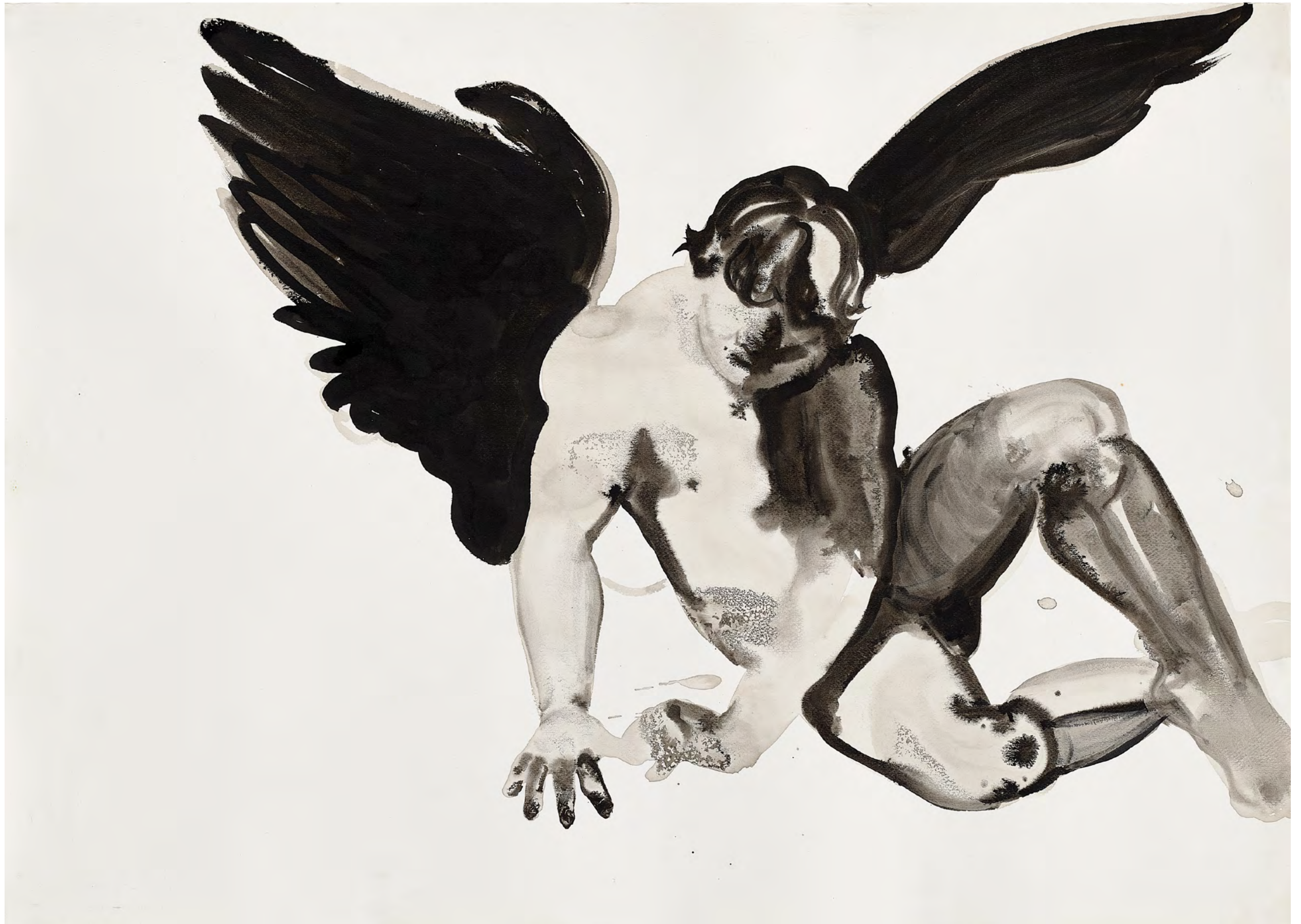
Angel of Death, 2017 Ink on paper 78 x 100 cm