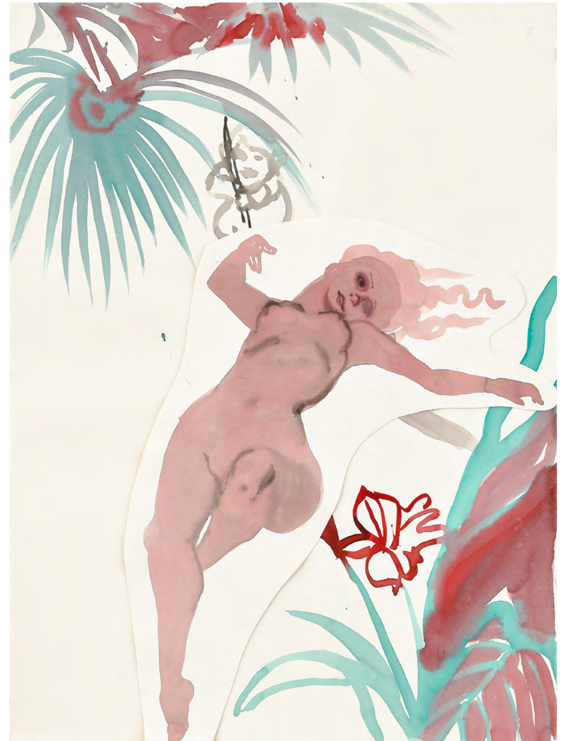
The Love Nymph, 2017 Watercolor and ink on paper 81.5 x 56.5 cm