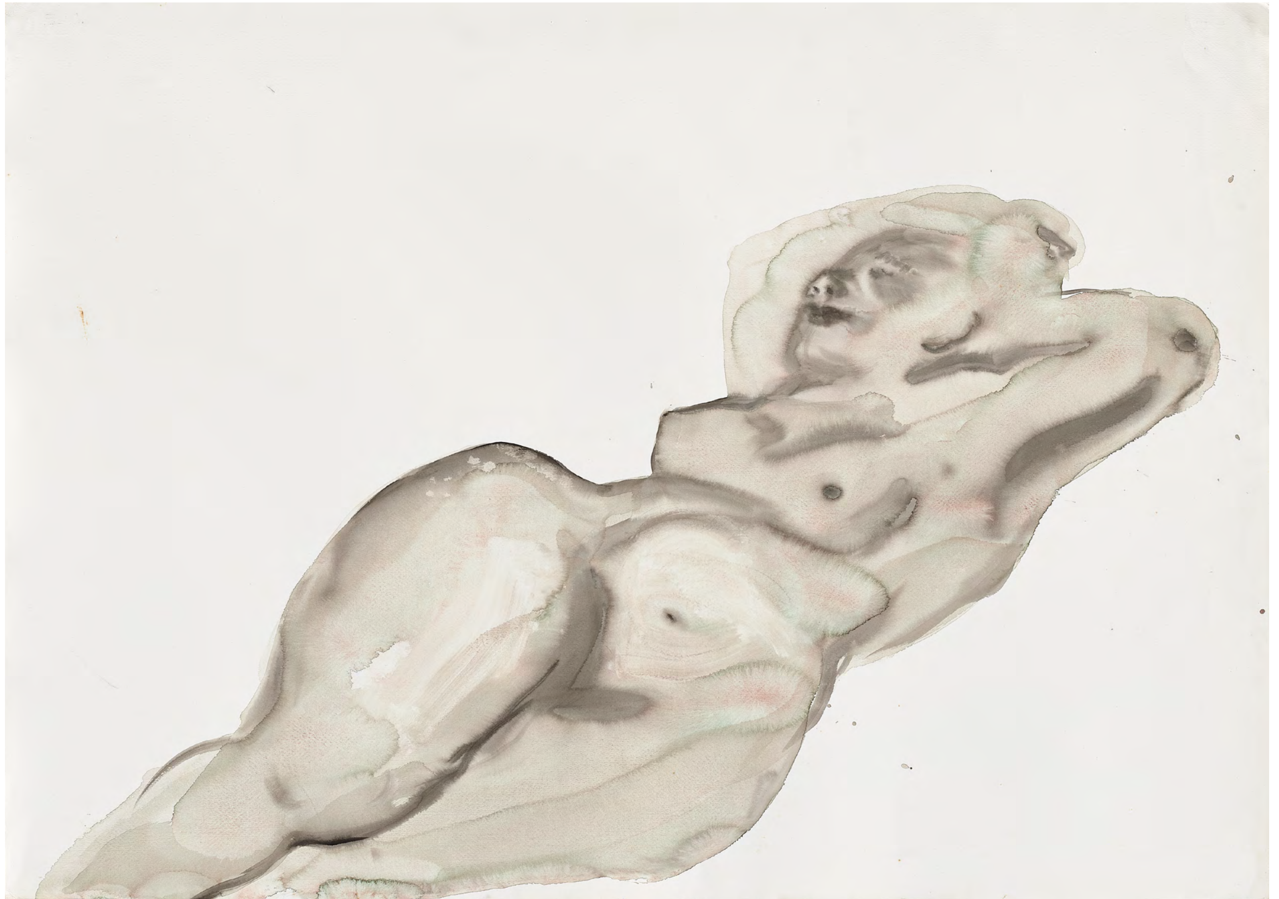
Angelica without the Hermit, 2014 Watercolor, ink on paper 71 x 100 cm