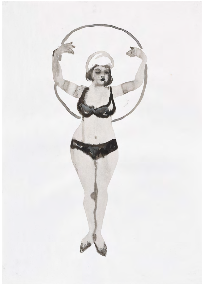
Untitled, 2017 Watercolor and ink on paper 54 x 38.5 cm