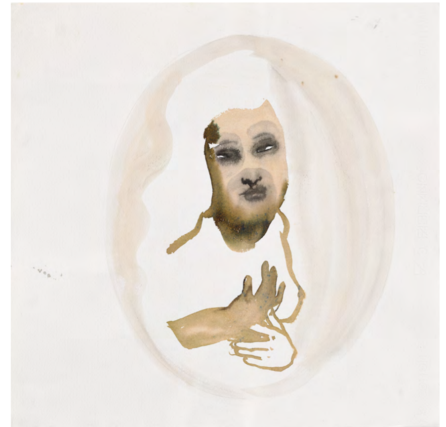
Love Stuck, 2016 Watercolor and ink on paper 50 x 50.5 cm