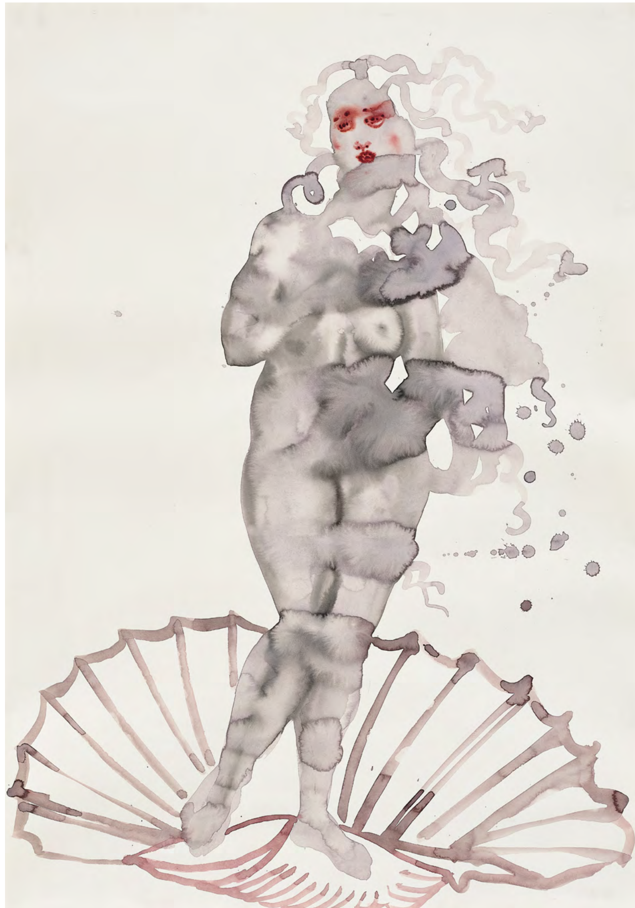
The Birth of Venus, 2018 Watercolor and ink on paper 114 x 81 cm