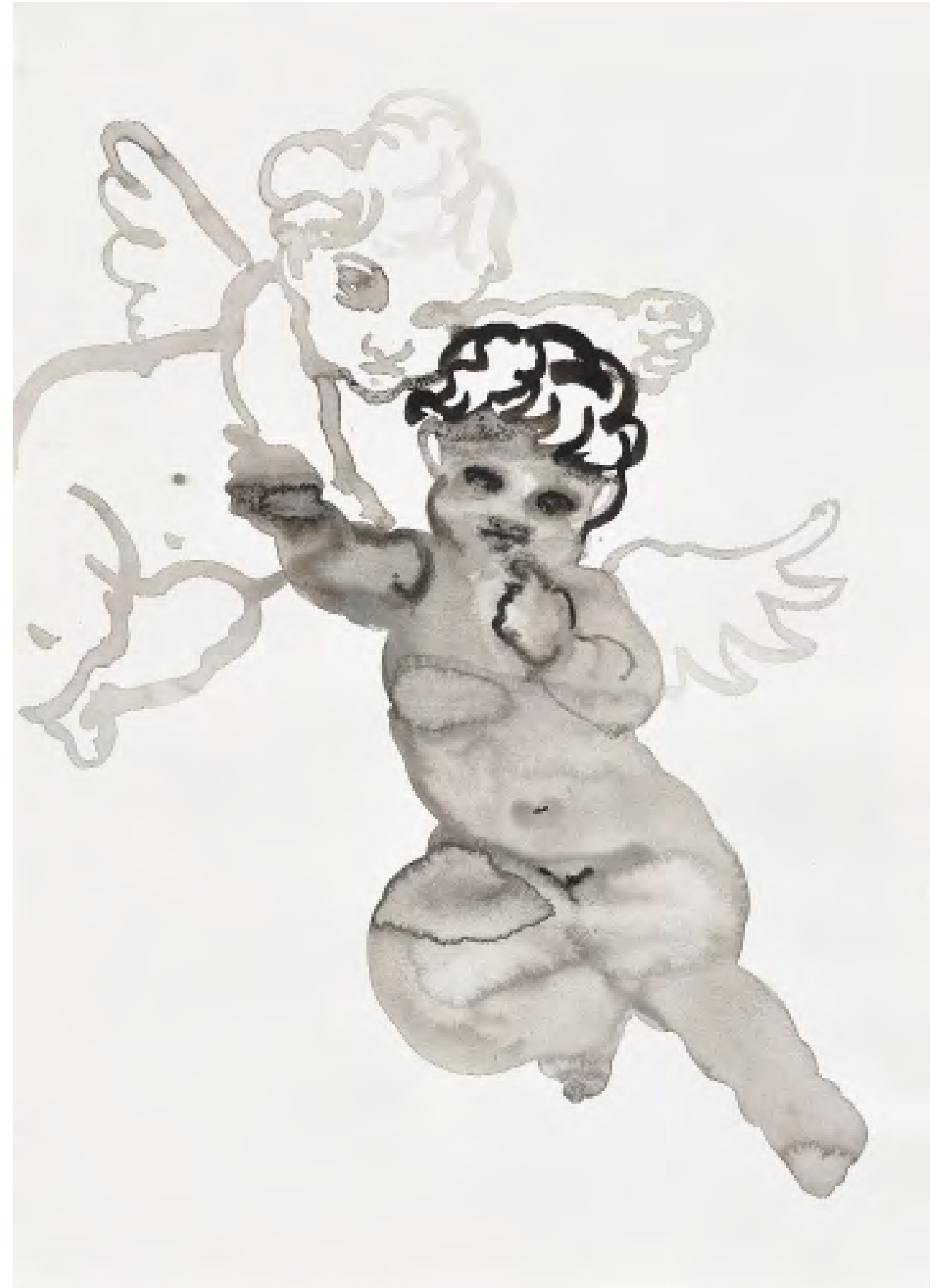
Untitled, 2017 Watercolor and ink on paper 70.5 x 50 cm