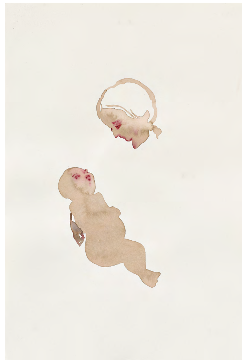
Madonna and Child, 2020 Watercolour on paper 57 x 38 cm