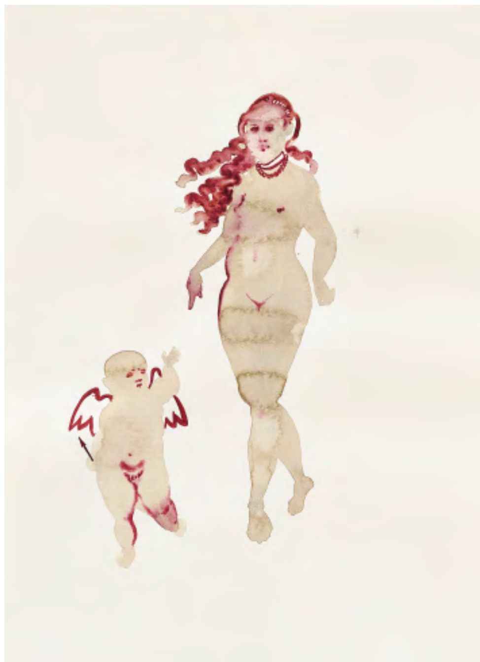
Venus and Cupid, 2022 Watercolor and ink on paper 53 x 38 cm