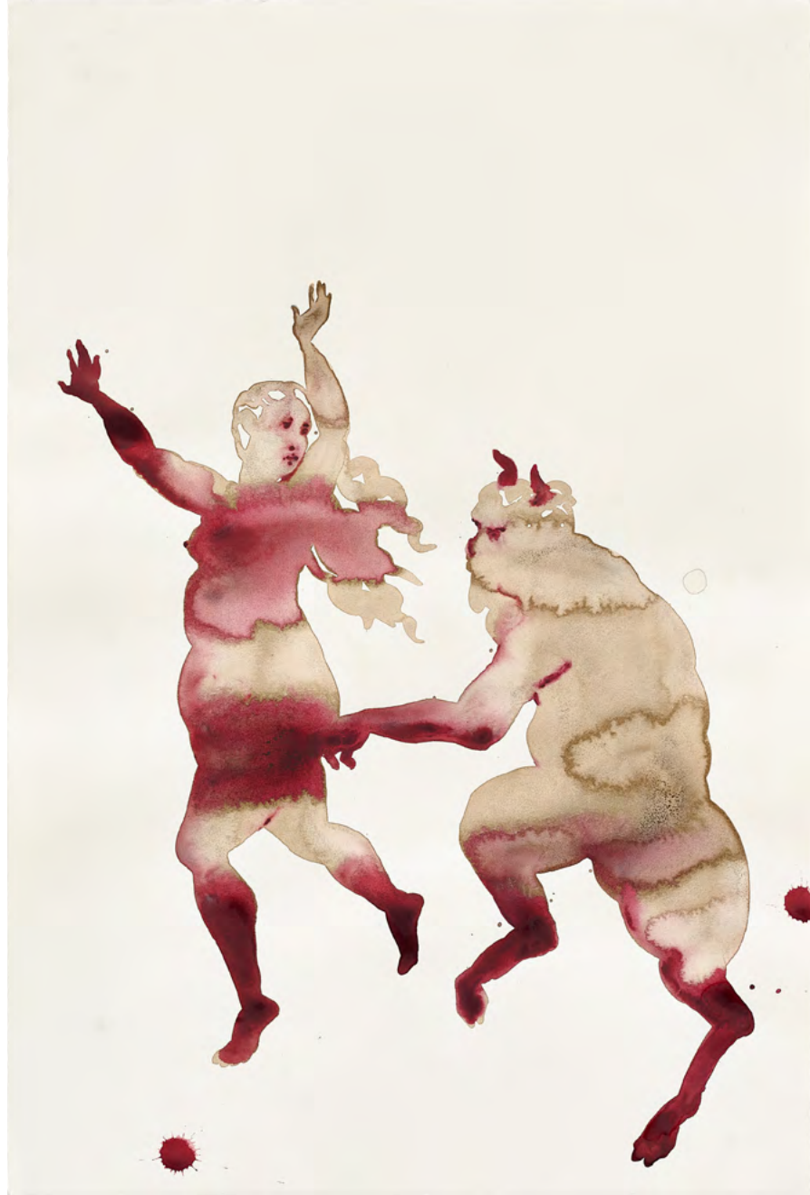
Pan and Syrinx, after Sebastiano Ricci, 2021 Watercolor and ink on paper 57 x 38.5 cm