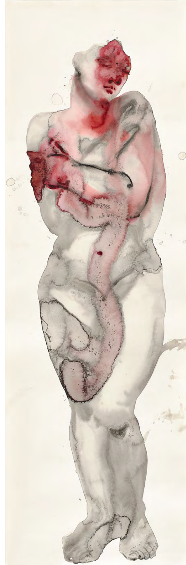
Untitled, 2018 Watercolor and ink on paper 142 x 46.6 cm