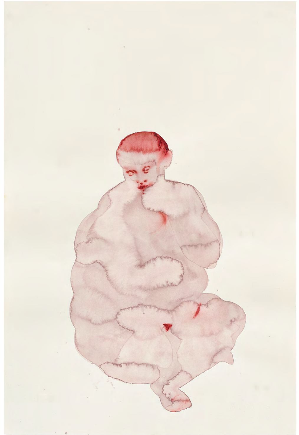
Untitled, 2023 Watercolor and ink on paper 57 x 38 cm