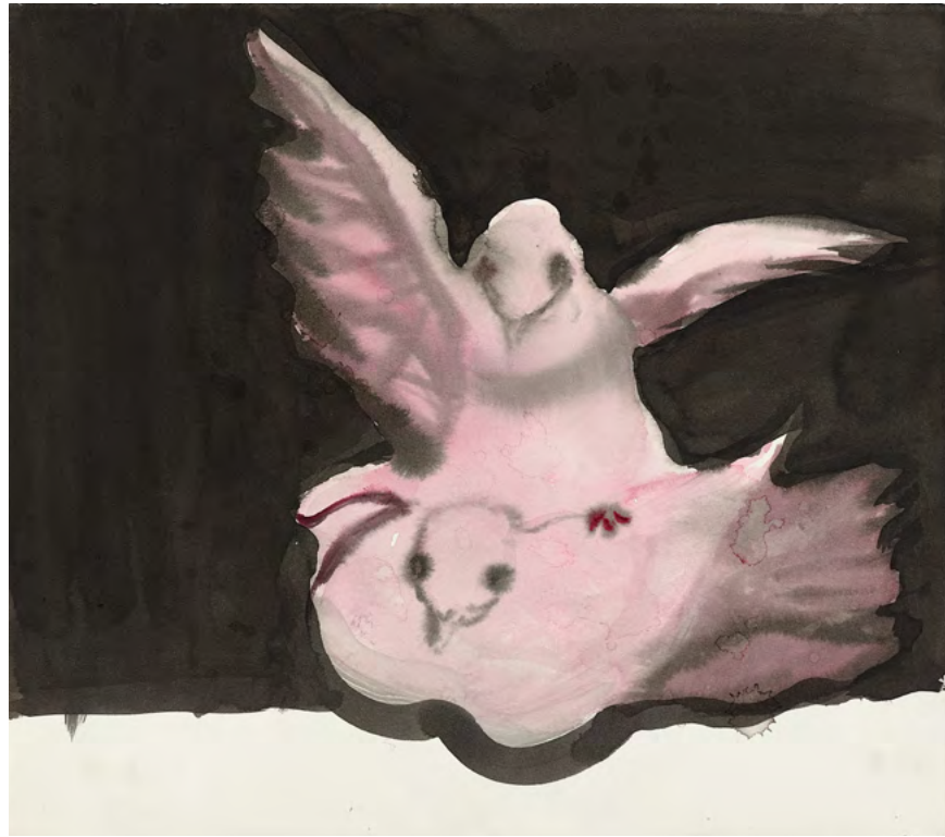
Untitled, 2016 Watercolor and ink on paper 28.5 x 32.2 cm