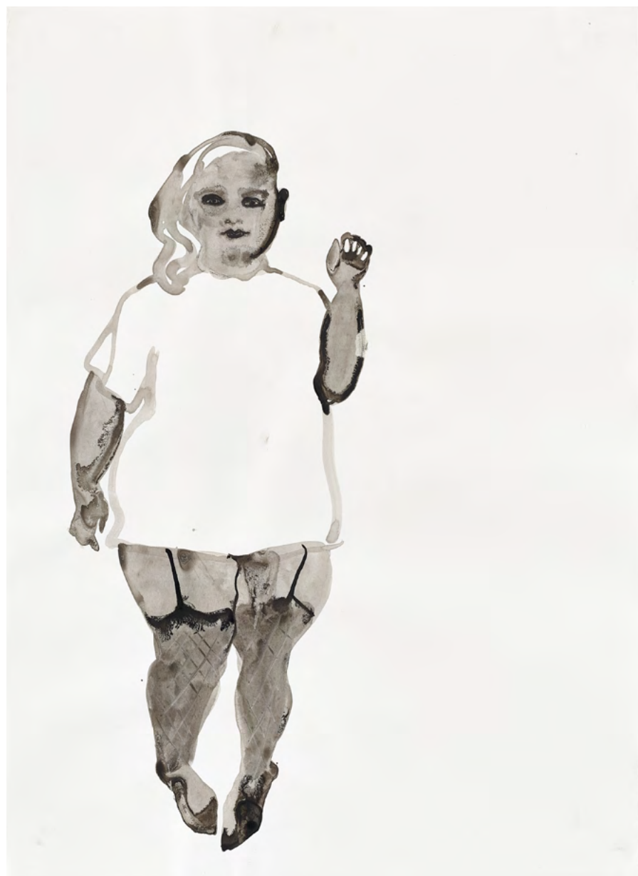
Untitled, 2017 Ink on paper 54 x 39 cm