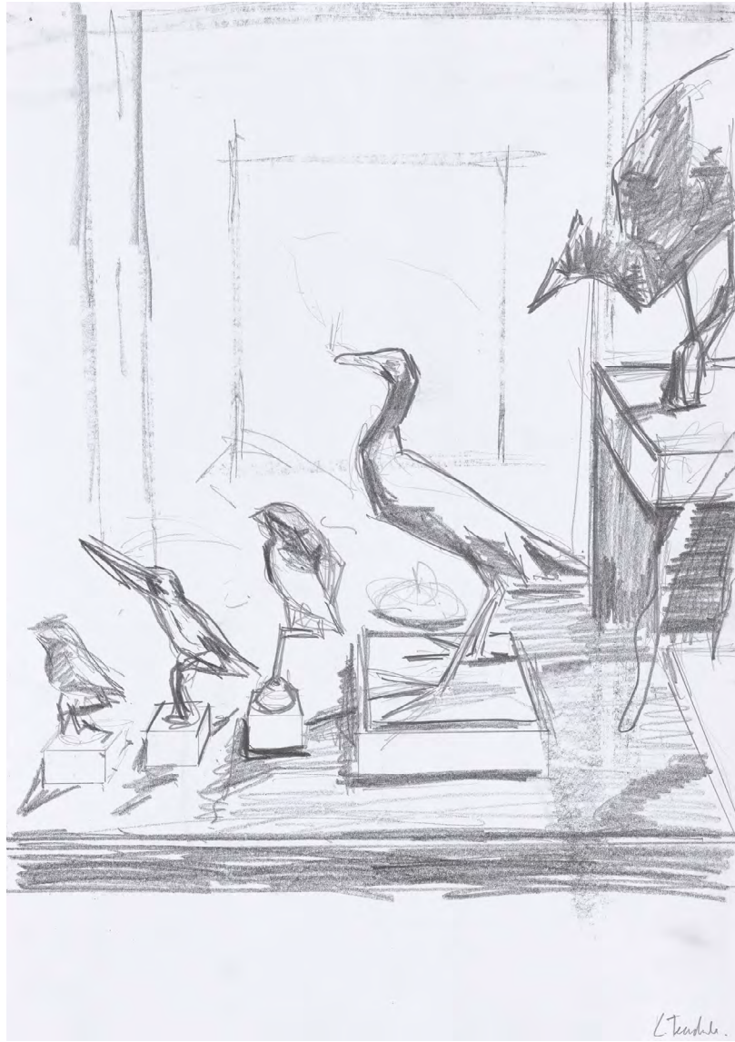
Curiosity | 2023 | Acrystal | 56 x 43 x 23 cm