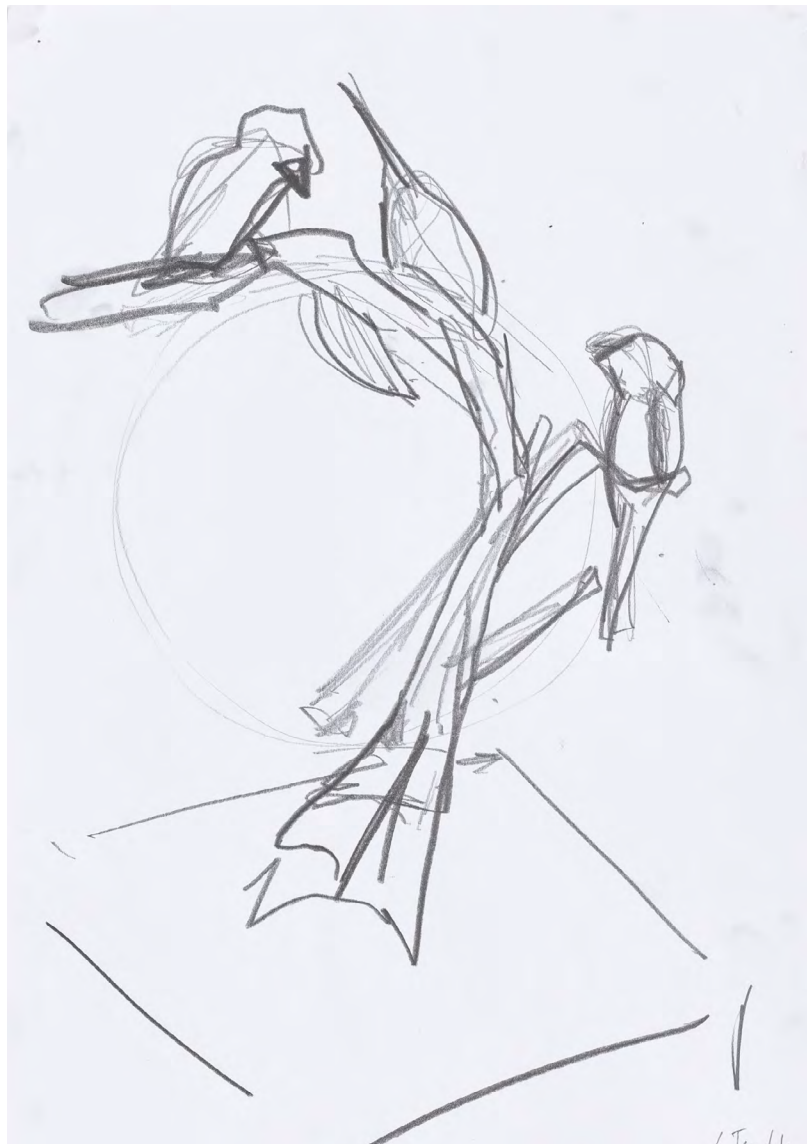
Abbildung Seite davor: Movement iii | 2023 | Glas | 18 x 9,5 x 5,5 cm Into the Woods | 2022 | Bronze, teilversilbert | Ex.: 2/3 | 59,5 x 45 x 27cm