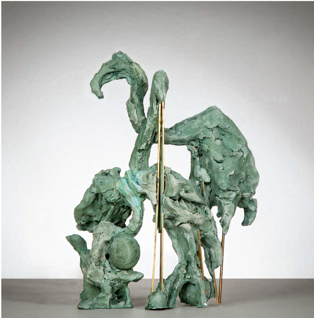
Green Flamingos | 2023 | Acrystal und Messing | 35 x 28 x 16 cm