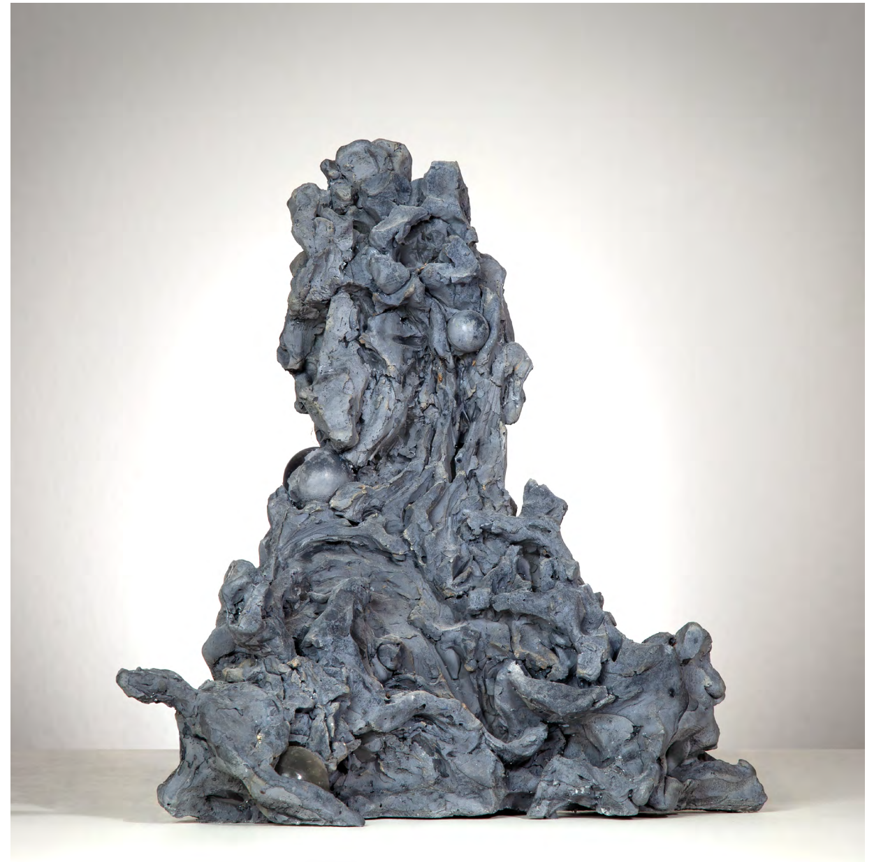
Help! A bear | 2022 | Acrystal, Messing, Glas | 38 x 29 x 27 cm