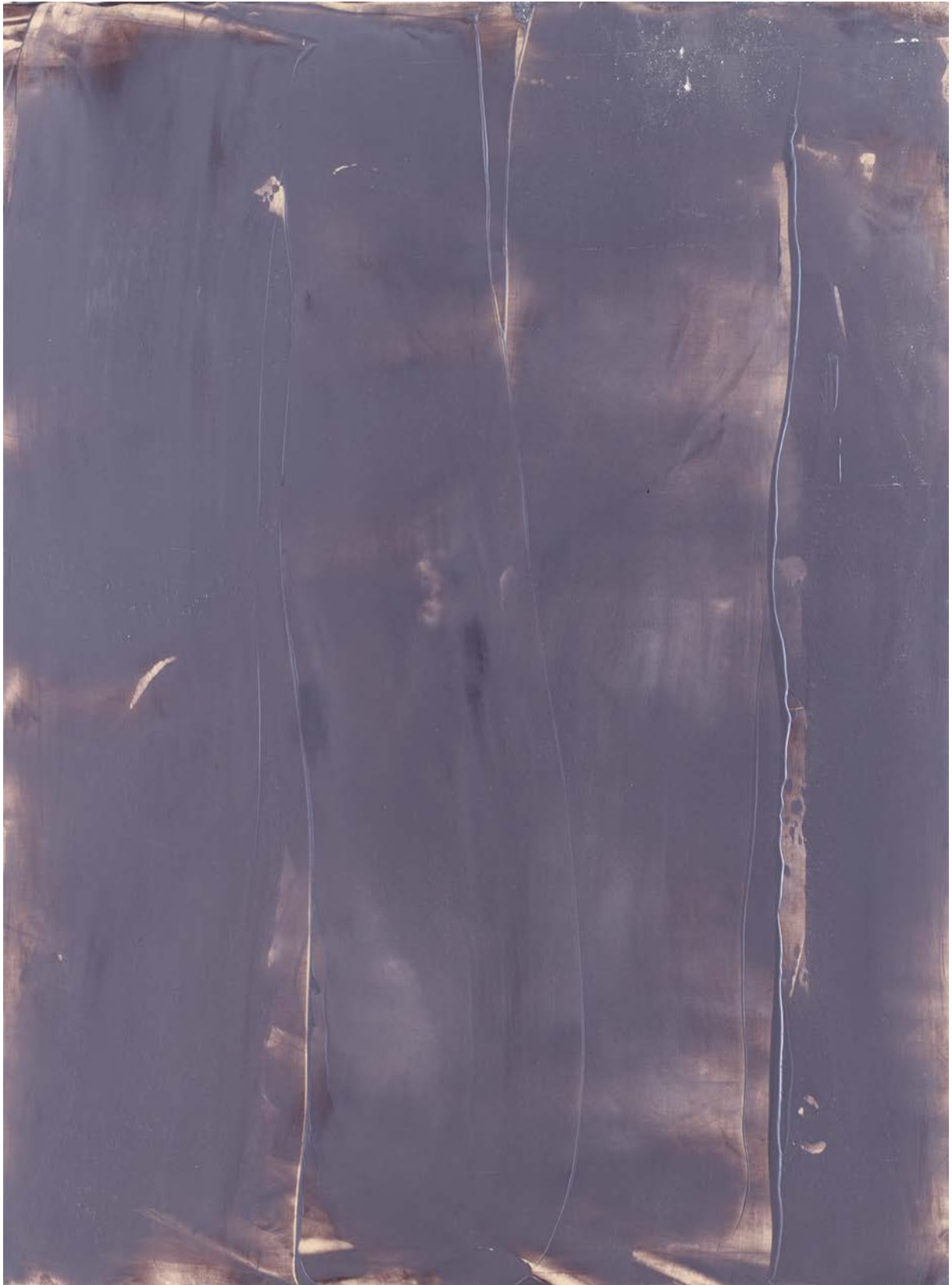
Gray Steel , 2018, Acryl auf Leinwand, 150x110 cm