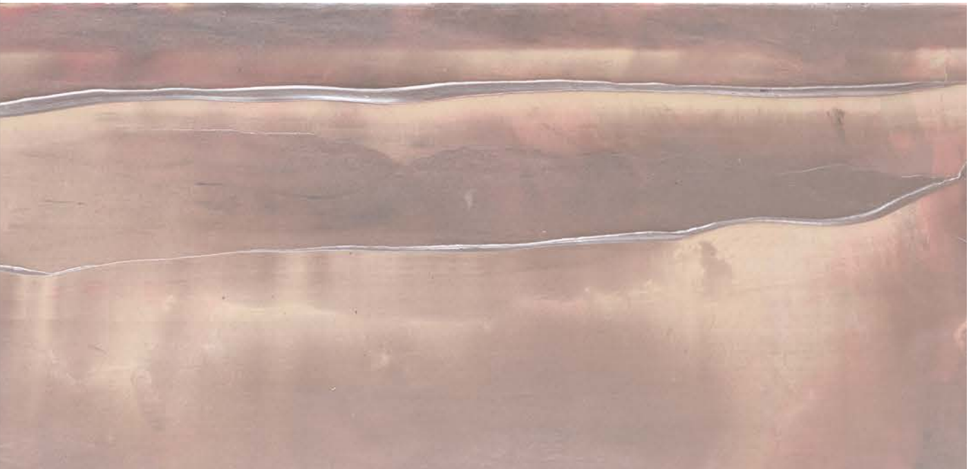
Dawson Dawn , 2018, Acryl auf Leinwand, 60x250 cm