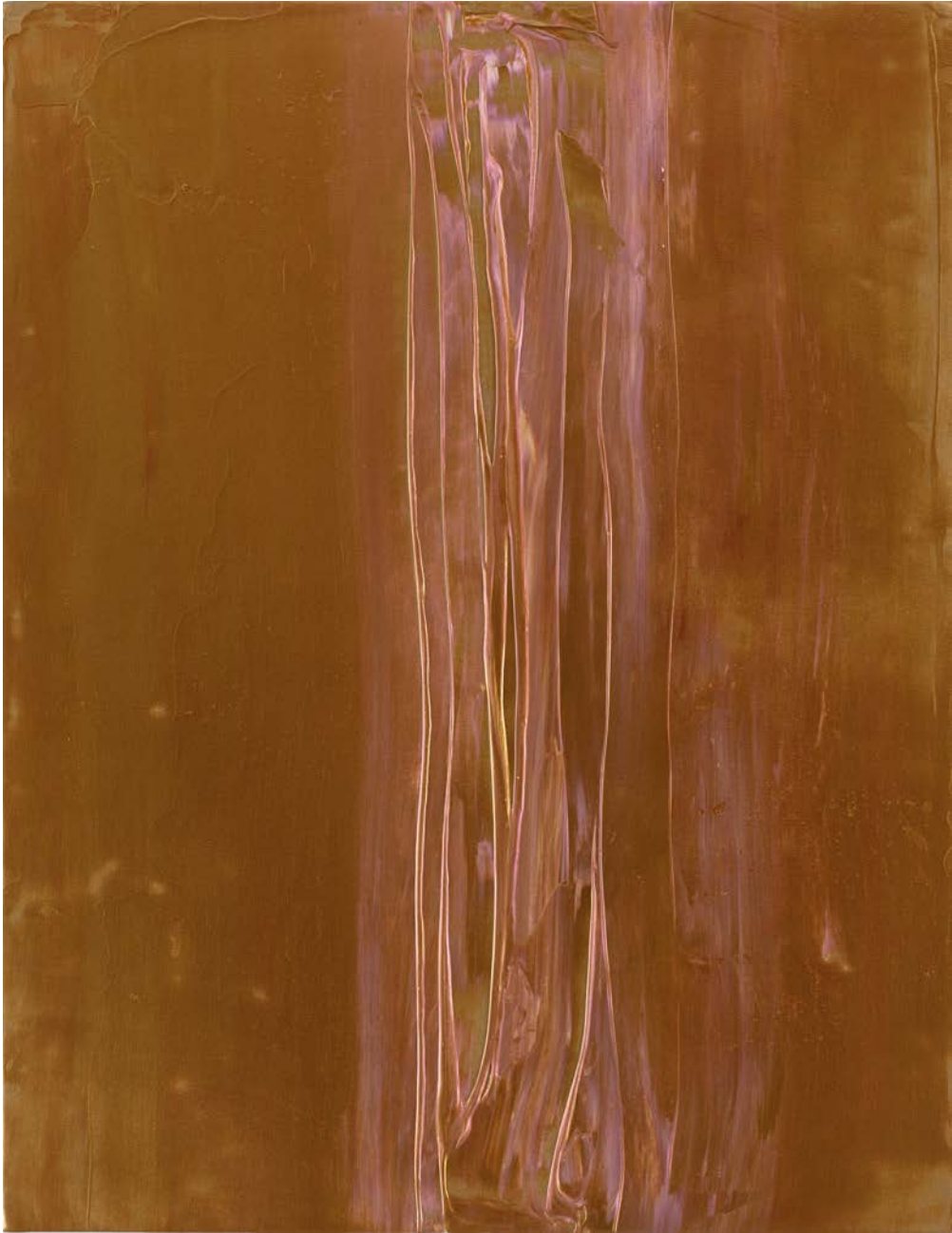
Midas , 2018, Acryl auf Leinwand, 118x91 cm