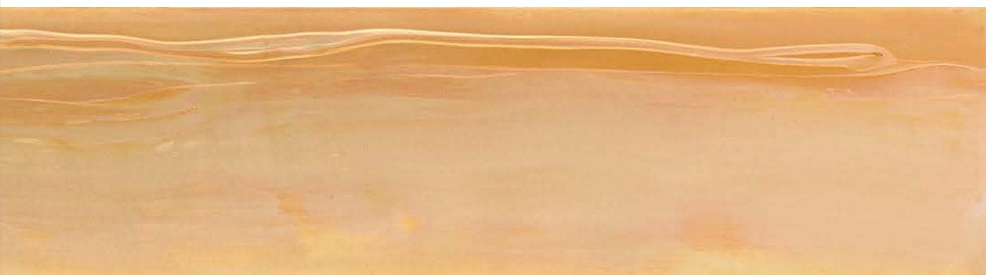
Paradise , 2018, Acryl auf Holz, 31 x 176 cm