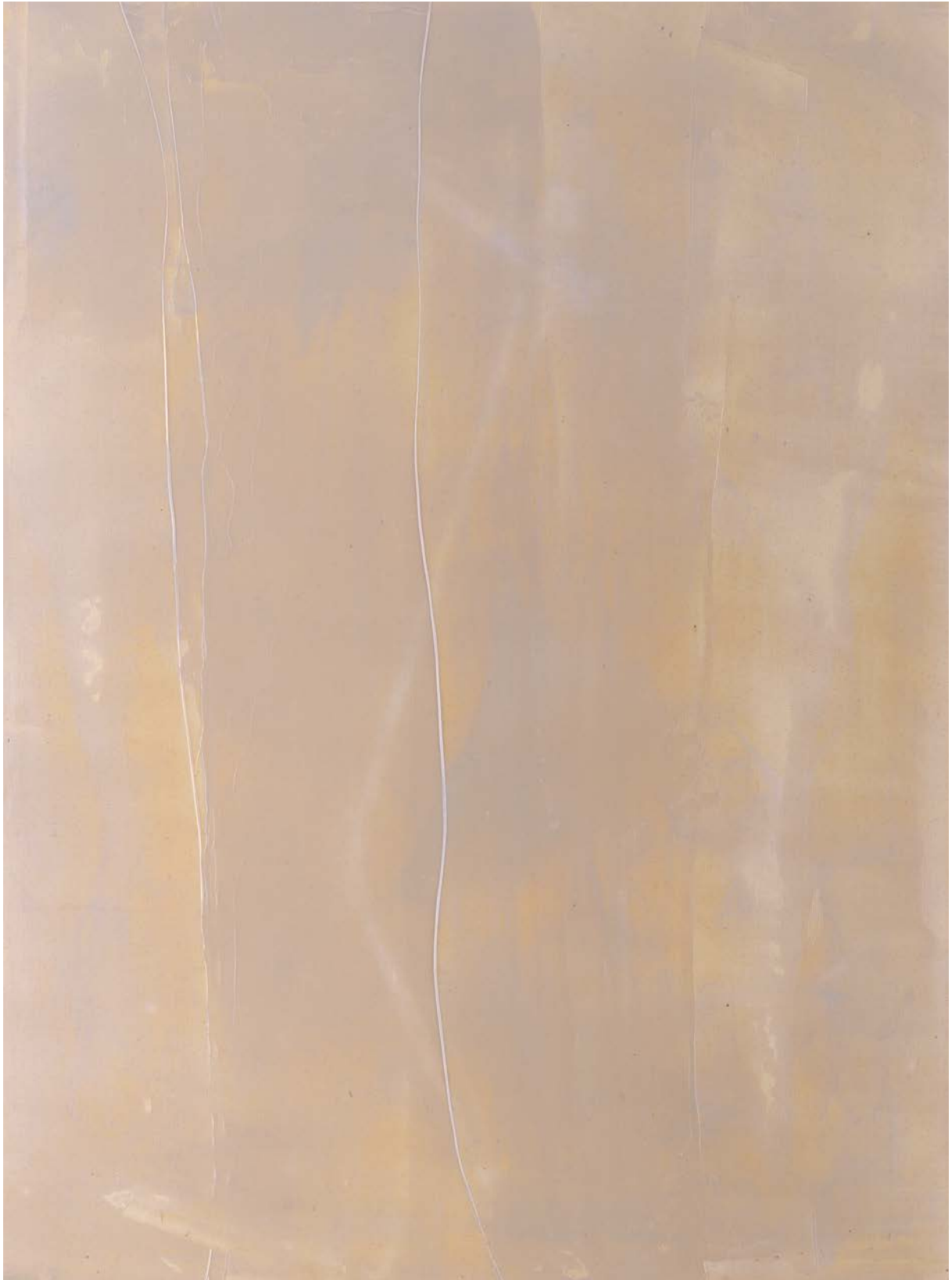
Lalule Steel , 2018, Acryl auf Leinwand, 140x118 cm