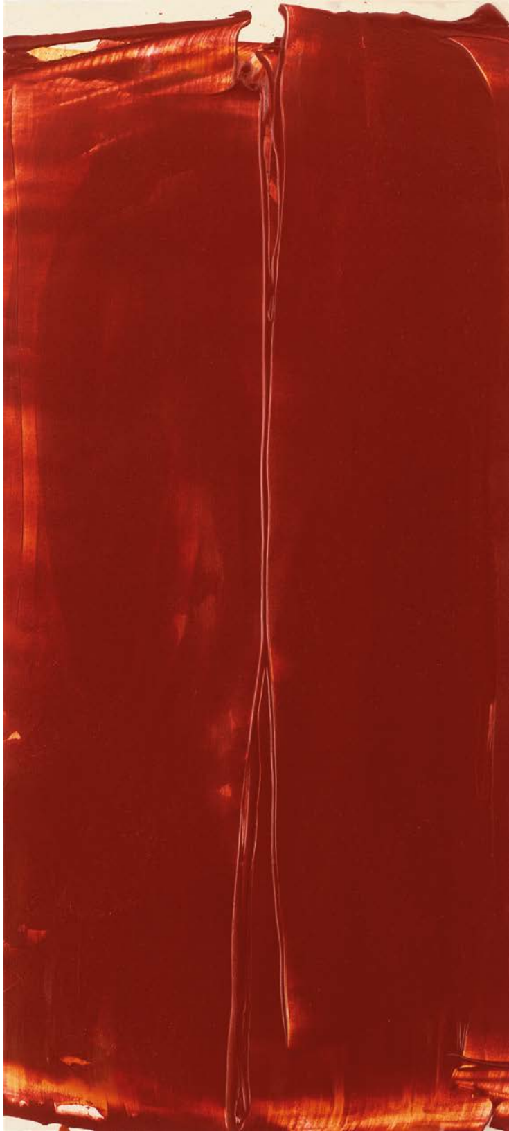
See-line woman , 2018, Acryl auf Leinwand, 145x66 cm