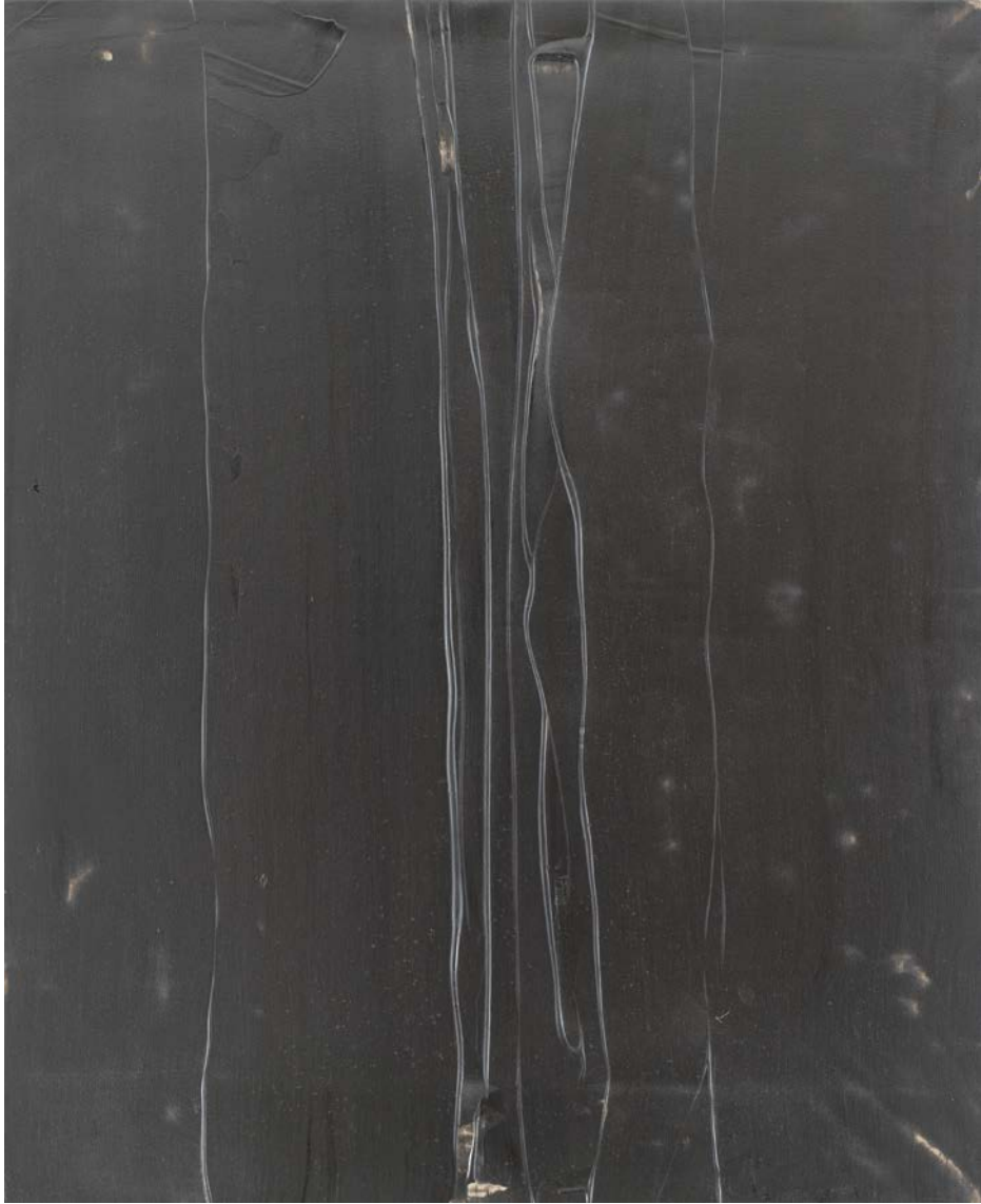
Saturn's gray chaos , 2018, Acryl auf Leinwand, 104x84 cm